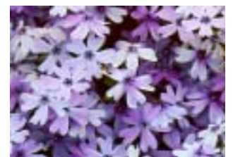
紫系シバザクラ(品種不詳)