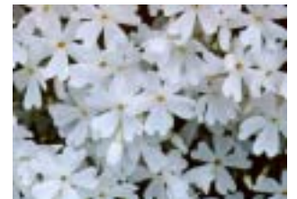
白系シバザクラ(品種不詳)